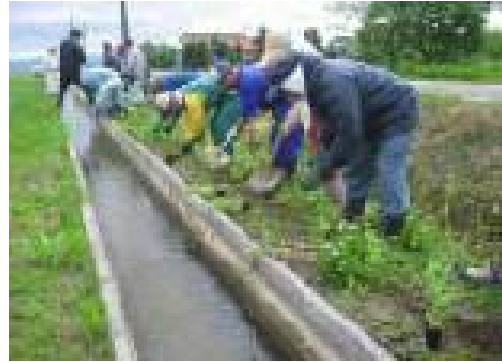
水路へのハーブ植栽