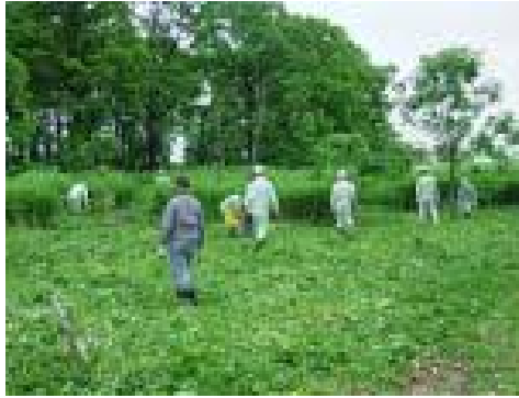
ビオトープ保全のための周辺草刈り