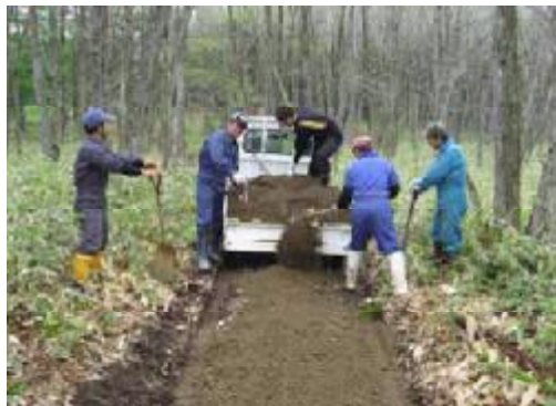
耕地防風林管理作業