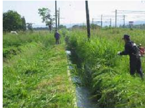
水路周辺の草刈り